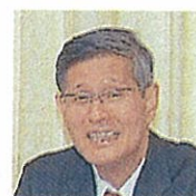
認定NPO全世代代表理事 尾身茂

医師不足で悩む地域であなたのキャリアを生かした第二の人生を歩みませんか。各様の応募をお待ちしております。